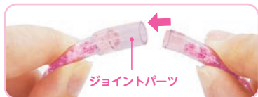
ジョイントパーツ

3 チューブの両端をジョイントパーツでつなげます。 ※キャラクターチャームを付ける場合はジョイントパーツでつなげる前にフックパーツを入れてください。